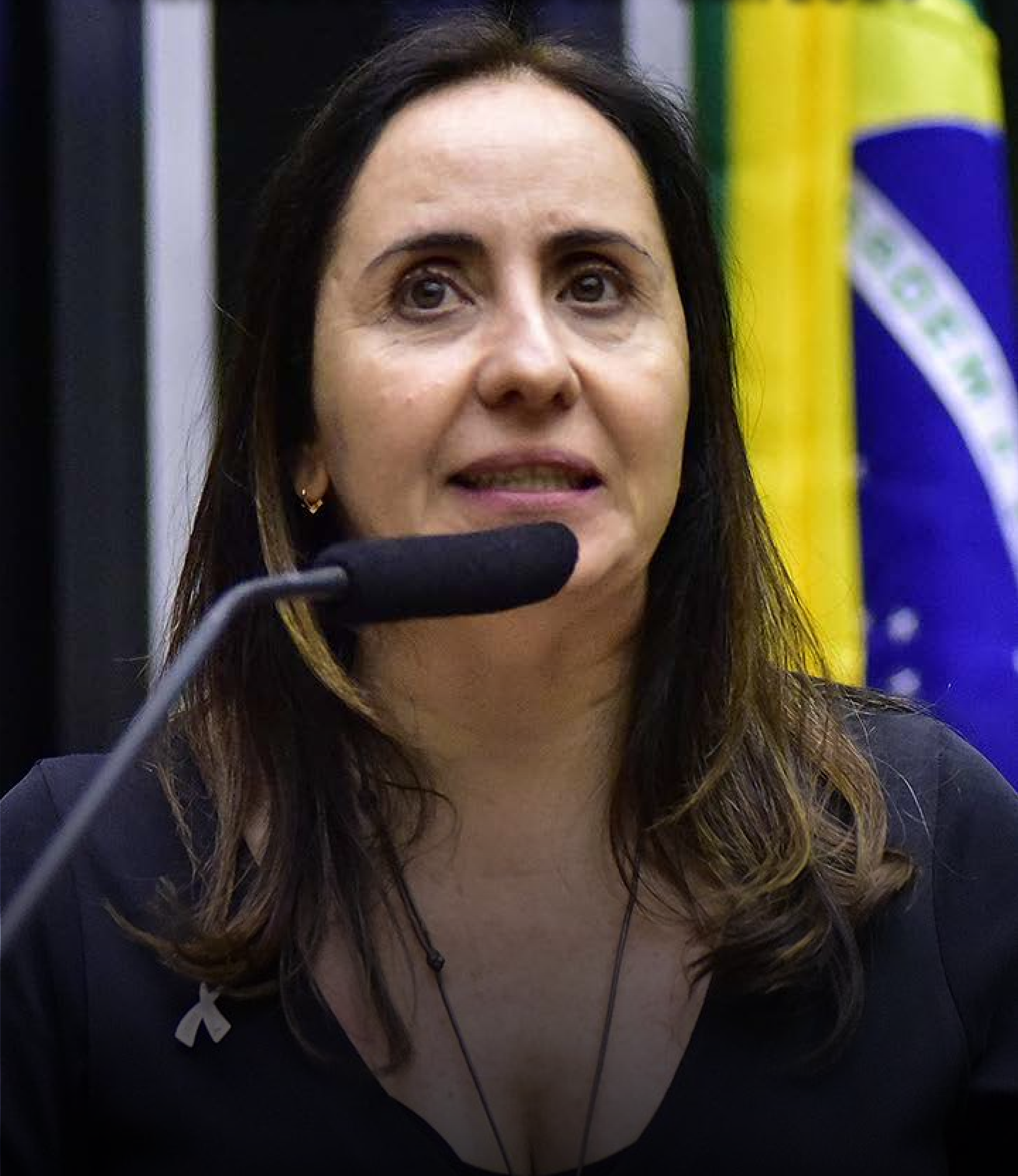
Adriana Ventura deputada federal